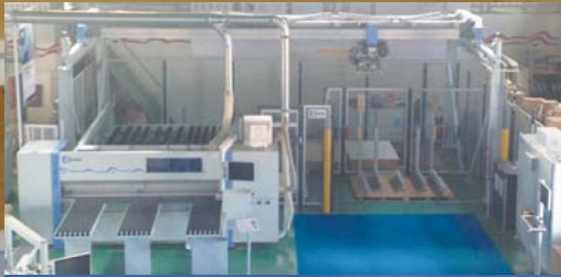
ホマッグジャパンに展示している ランニングソーと自動倉庫

ホマッグジャパン・大阪ショールームに Holzma 社 ランニングソー と Homag Automation 社 自動倉庫 を 展示していますので、是非ご来場下さい！ (展示中の自動倉庫は、後ろ方向最大20mまで拡張可能です。)