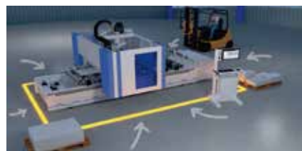
360° どこからでもアクセス

全世界 35,000 台以上納入している加工用プログラム『woodWOP』が標準装備されているだけでなく、圧倒的スピードでキャビネット設計を完結するソフトウェア『woodCAD|CAM』の連携にも最適です。