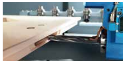
多様なアグリガード (写真: ロックケース用水平深掘り)