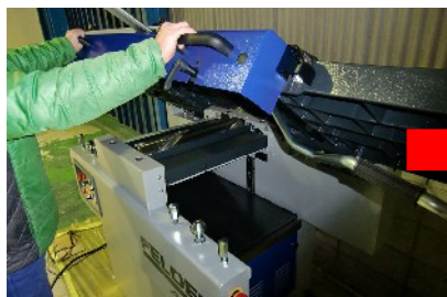
定盤を持ち上げて