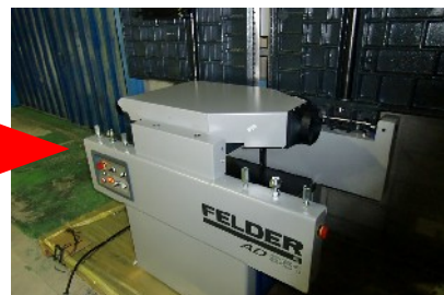
自動鉋に早変わり