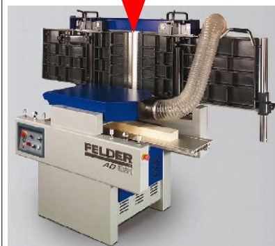
このような形で使用します