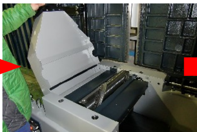
集塵カバーをおこして