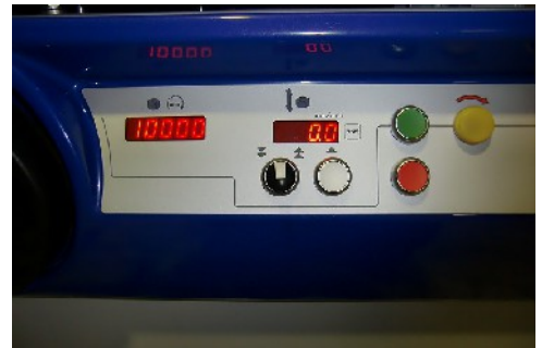
LED表示電動スピンドル昇降