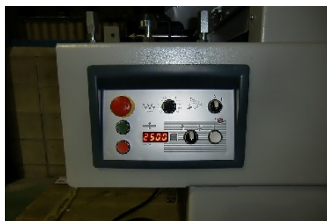
LED表示電動昇降など簡単な操作