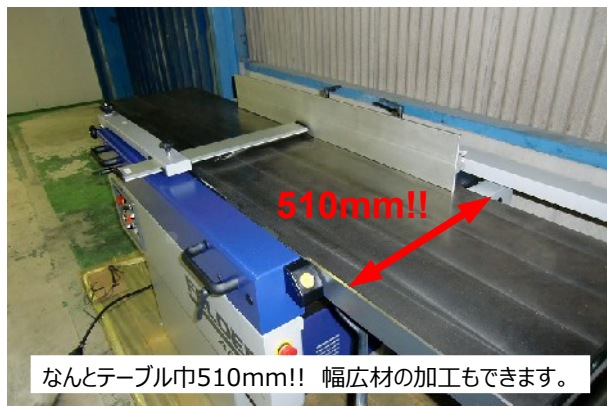
なんとテーブル巾510mm!! 幅広材の加工もできます。