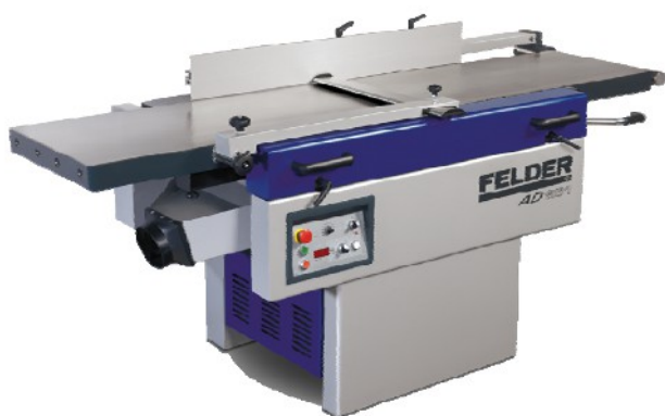
手押し鉋+自動鉋 兼用機 AD951

手押し鉋+自動鉋 兼用機 これ1台で手押し、自動どちらも可能です。 なんと500mm巾の加工が可能なワイドなカンナです。 しかも静音タイプ、スパイラルカッター付き