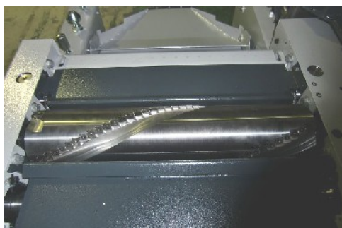
静音タイプ超硬換え刃式スパイラルカッター